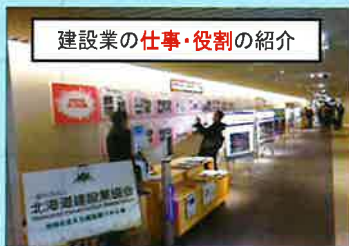
建設業の仕事・役割の紹介

※新型コロナウイルス感染症の 感染予防対策を十分講じた上で、 様々な取組を予定しています。 なお、今後の新型コロナウイルス 感染症の感染状況によっては、 内容等が変更になる場合があり ます。