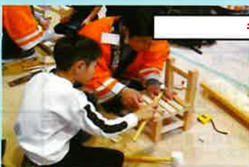
ものづくりで建設産業を体験! 実感!