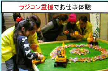
ラジコン重機でお仕事体験