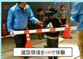
建設現場をVRで体験