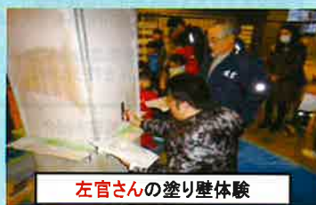
左官さんの塗り壁体験