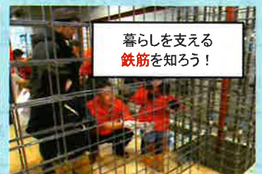
暮らしを支える 鉄筋を知ろう!