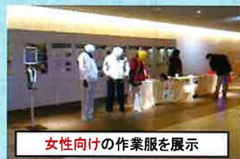
女性向けの作業服を展示