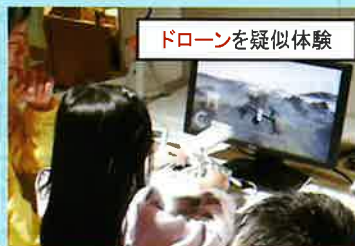
ドローンを疑似体験