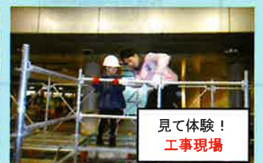
見て体験! 工事現場